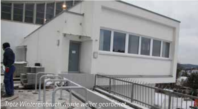
Trotz Wintereinbruch wurde weiter gearbeitet

Katholische Kirchengemeinde Dreifaltigkeit Heidenheim